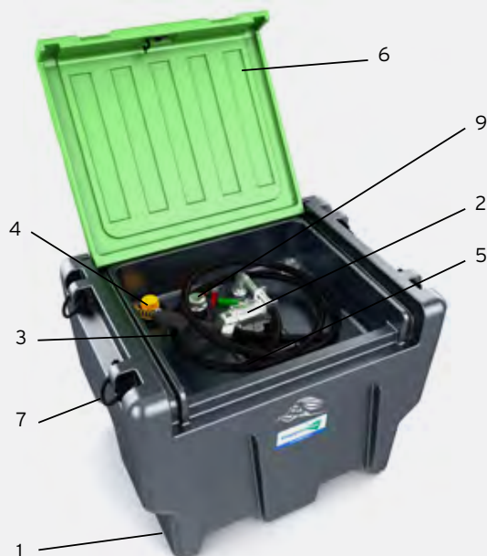
TruckMaster® 430 L