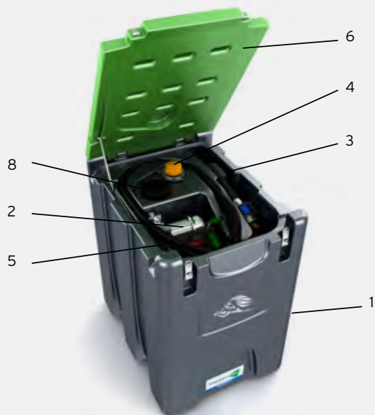
TruckMaster® 300 L